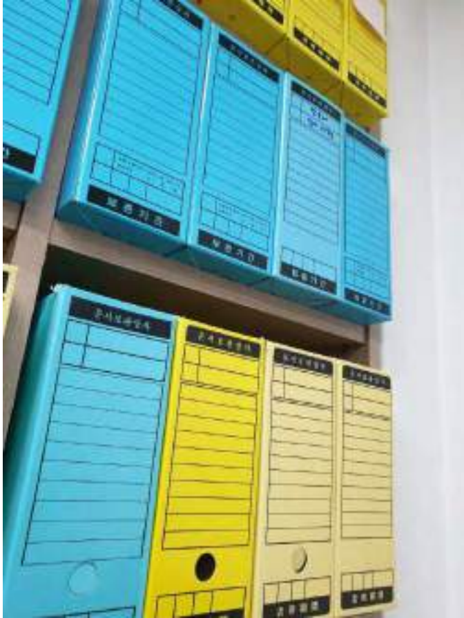
文書箱に整理、保管