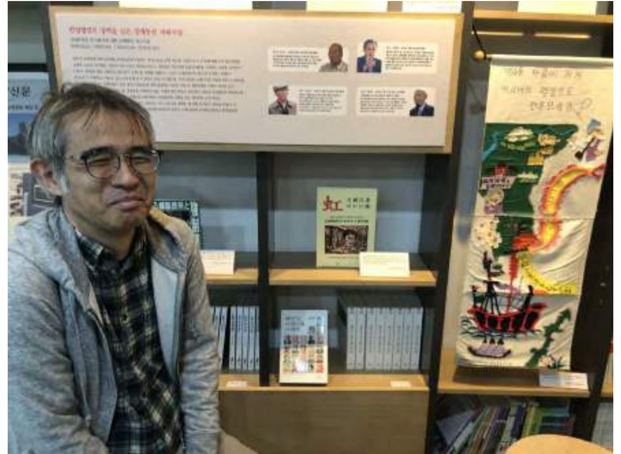
2019年企画展 <奪われたオボイを偲んで>