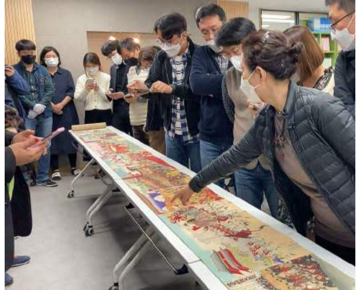
教師研修・市民講座